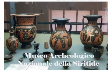
Museo Archeologico Nazionale della Siritide